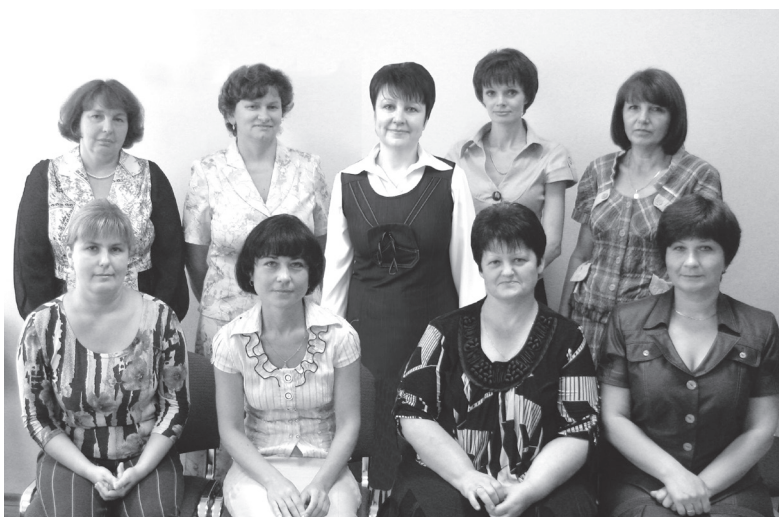
Сотрудники финансового отдела Буда-Кošелевского райисполкома

На ритмичности поступления ресурсов и своевременном финансировании расходов сказывается и переход значительной части организаций на поквартальную уплату налогов. Широкое применение данной практики привело к появлению кассовых разрывов, которые достаточно сложно закрыть. Это иллюстрирует схема.