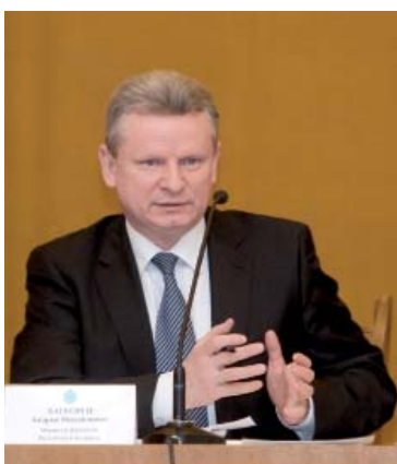
Андрей ХАРКОВЕЦ, Министр финансов Республики Беларусь

Строжайшая исполнительская дисциплина — важнейшая составляющая нашей работы