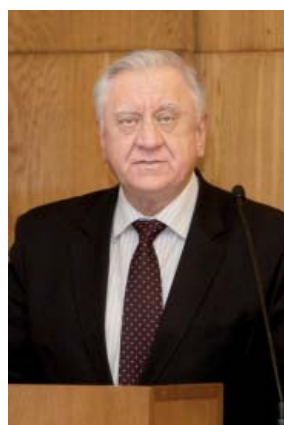
Михаил МЯСНИКОВИЧ, Премьер- министр Республики Беларусь

От политики стабилизации — к политике развития, или 10 задач на текущий год