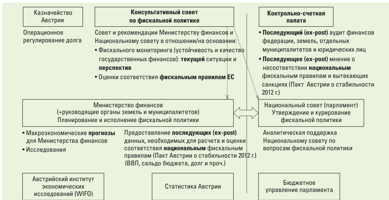
РИС. 3. ВЗАИМООТНОШЕНИЯ В РАМКАХ ФИСКАЛЬНОЙ ПОЛИТИКИ В АВСТРИИ