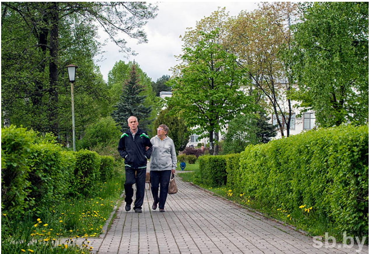
Около 80 процентов мест в белорусских санаториях на лето уже забронировано.

Кстати, в Мядельском районе, который традиционно считается белорусской «здравницей» и одним из лидеров по числу санаторно-курортных заведений, сбор платить не нужно. Там с 2000 года с посетителей санаториев, зон отдыха и туристско-оздоровительных комплексов берут компенсационные выплаты. Их размер привязан к базовой величине, и идут эти средства потом не в бюджет Мядельского района, а на счет Национального парка «Нарочанский» для проведения природоохранных мероприятий.